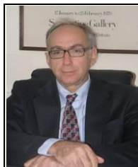
Διευθυντής: Καθηγητής Σ. Σούλης Οικονομικά της Υγείας και Κοινωνικής Προστασίας

πρ. Εμπειρογνώμων στη Διεύθυνση Κοινωνικών Υποθέσεων του OECD, European Commission πρ. Αντιπρόεδρος της Επιτροπής Εμπειρογνομώνων για την αναμόρφωση του ΕΣΥ πρ. Σύμβουλος του Υπουργείου Υγείας και του Υπουργείου Εργασίας πρ. Εθνικός εκπρόσωπος στο Διεθνές Γραφείο Εργασίας (ILO) και στη Διεθνή Ένωση Κοινωνικής Ασφάλειας (AISS) Επιστημονικός Συνεργάτης του Ιδρύματος Ιατροβιολογικών Ερευνών Ακαδημίας Αθηνών πρ. Αντιπρόεδρος Τεχνολογικού Εκπαιδευτικού Ιδρύματος Ιονίων Νήσων Αντιπρόεδρος της Επιτροπής Ερευνών ΤΕΙ Αθηνών Επιστημονικός Υπεύθυνος Εκδοτικής Σειράς